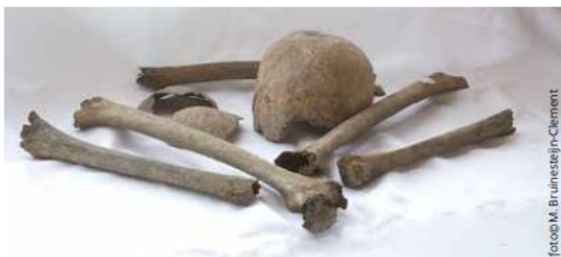
De botten van Oud-Zaanden.