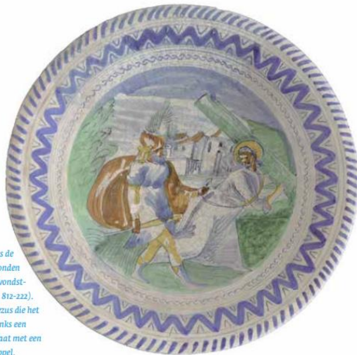
Het bij de woningen langs de Hogendijk gevonden majolicabord (vondstnummer HD II 812-222). Rechts staat Jezus die het kruis draagt, links een Romeinse soldaat met een zwaard of knuppel.

Piet Kleij, gemeentelijk archeoloog Zaanstad, Oostzaan en Wormerland