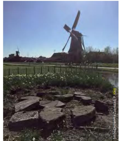
De brokken molensteen op het terrein waar het nieuwe Molenmuseum - aan de noordkant van de Zaanse Schans - zal verrijzen.

In feite hebben er drie molens gestaan op de plek van De Jonge Prinses. De eerste, een achtkantige molen met stelling van vermoedelijk beperkt formaat, werd gebouwd in 1686 en vanwege de economische crisis in 1794 afgebroken. Deze molen heette 'De Prinses'. In 1817 verrees op dezelfde plek een nieuwe molen, De Jonge Prinses, die in 1868 afbrandde. Dit was ook een achtkantige molen met stelling. Een jaar later herbouwde men de molen die dezelfde naam kreeg maar soms ook 'De Feniks' werd genoemd. Deze laatste pelmolen, één van de grootste molens die ooit in de Zaanstreek heeft gestaan, was het resultaat van driehonderd jaar ontwikkeling in de Zaanse molenindustrie. De werkput is aangelegd op de plaats waar de sloot zou komen. In de put zijn 3 zeer grote poeren gevonden, 6 middelgrote poeren,