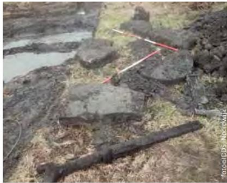
De vondsten van het eerste onderzoek bij De Jonge Prinses: brokken molensteen en een klauwwijzer.