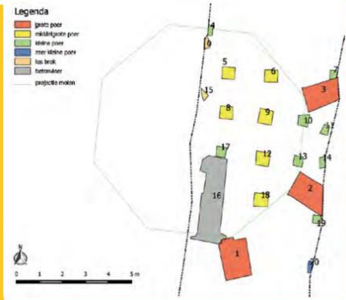
Detail van de veldtekening met daarop de helft van de plattegrond van molen De Jonge Prinses. Duidelijk is het verschil in grootte van de poeren.