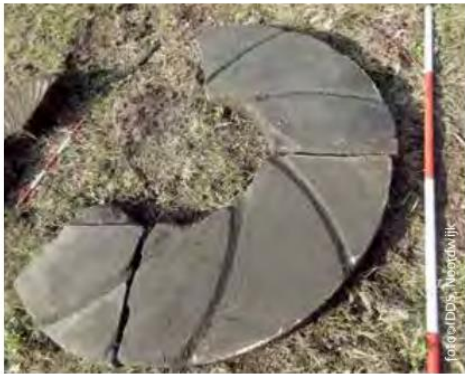
Een pelsteen van De Jonge Prinses met windkerven.